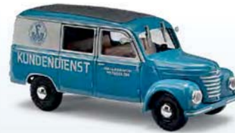
51288 Barkas V901/2 Halbbus Nr. 1 VEB Fahrzeugwerk Waltershausen

Tolles Modell – tolle Sammelserie! Acht Barkas V901/2 als Halbbus oder Kastenwagen in unterschiedlicher Bedruckung bilden eine in sich abgeschlossene kleine Sammel-Serie streng limitierter Modelle. Jeder Verpackung liegt ein kleines Puzzleteil bei. Wer alle acht Modelle hat, schickt uns einfach bis Ende Februar 2019 das komplette Puzzlebild zu und erhält das kostenlose Sammel-Bord. Das Bord kann käuflich nicht erworben werden.