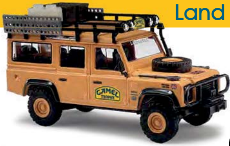
50367 Land Rover Defender Camel Trophy 1989 Amazonas Siegerfahrzeug England