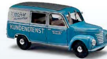
51289 Barkas V901/2 Halbbus Nr. 2 Möve Fahrräder Mühlhausen