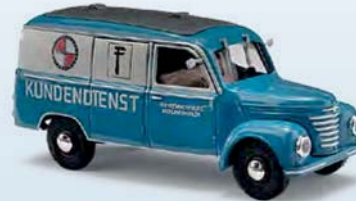
51247 Barkas V901/2 Kastenwagen Nr. 6 VEB Instandsetzung Bad Langensalza