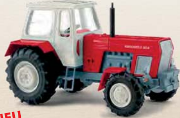
NEU 42848 Traktor Fortschritt ZT 303-D Rot, Baujahr 1967