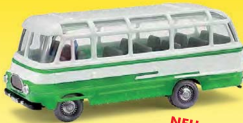
NEU 95707 Robur LO 2500 Dekor, Grün