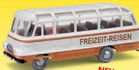
NEU 95709 Robur LO 2500 Freizeit-Reisen, Braun