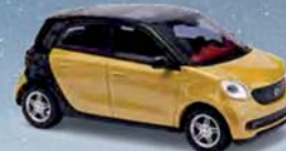
49555 Smart Forfour »CMD-Collection«, Baujahr 2014