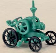
59907 Gummi Bulldog »Lanz«, Baujahr 1921