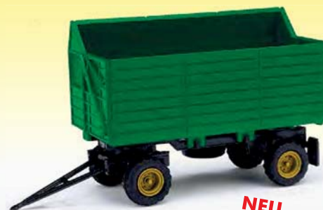
NEU 95028 HW 80 SHA Grün mit gelben Felgen