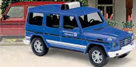
51460 Mercedes-Benz G-Klasse »THW«, Baujahr 2008