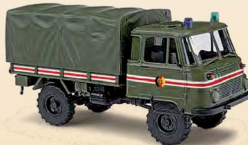
50228 Robur LO 2002 A »Kommandantendienst Schlussfahrzeug«