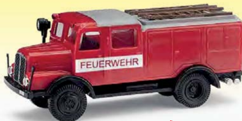
NEU 95604 IFA S4000 TLF mit Bauchbinde