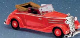
40510 Mercedes-Benz 170S Baujahr 1949