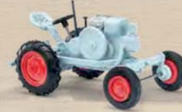
59911 Traktor Kramer K12 mit Güldner-Motor, Baujahr 1938