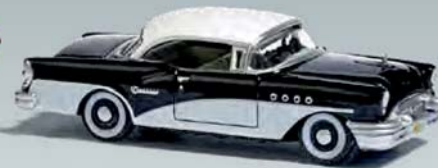
NEU 201 128583 Buick Century 1955, Schwarz/Weiß