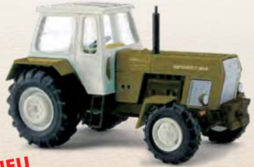
NEU 42849 Traktor Fortschritt ZT 303-D Grün, Baujahr 1967