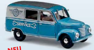
NEU 51293 Barkas V901/2 Halbbus Nr. 8 KFZ Werk E.Grube Werdau