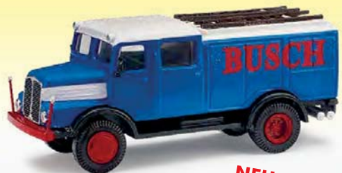
NEU 95606 IFA S4000 TLF Zirkus Busch