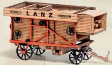
59902 Dreschmaschine 1:87 »Lanz«