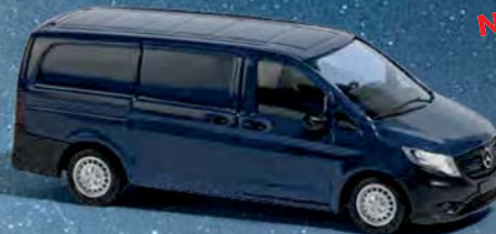
51107 Mercedes-Benz Vito Blau, Baujahr 2014