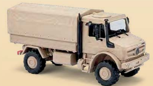
51020 Mercedes-Benz Unimog U 5023 Militär, Sandfarben, Baujahr 2014