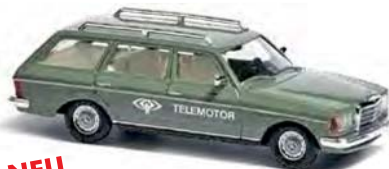
NEU 46813 Mercedes-Benz W123 »ZDF Telemotor«, Silberdistel metallic, Baujahr 1977