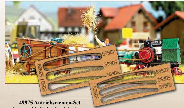
49975 Antriebsriemen-Set 6 unterschiedliche Antriebsriemen