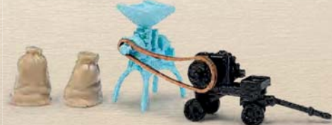
59904 Deutz TYP MA 511 Stationärantrieb mit Schrottmühle, Baujahr 1931