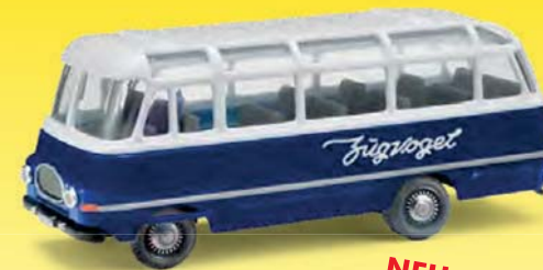
NEU 95706 Robur LO 2500 Zugvogel, Blau