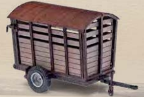
59930 Anhänger »Kälberanhänger«