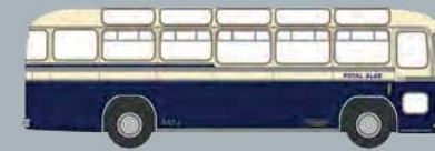
NEU 200 128880 Bristol MW6G Dunkelblau