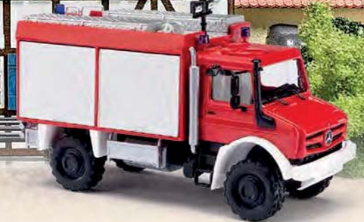
51052 Mercedes-Benz Unimog U 5023 mit Schlingmannaufbau, Baujahr 2014