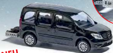
NEU 50663 Mercedes-Benz Citan Kombi mit Wildkorb und Reh, Baujahr 2013