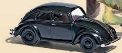
42735 VW Käfer »KDF« mit Plakat, Baujahr 1939