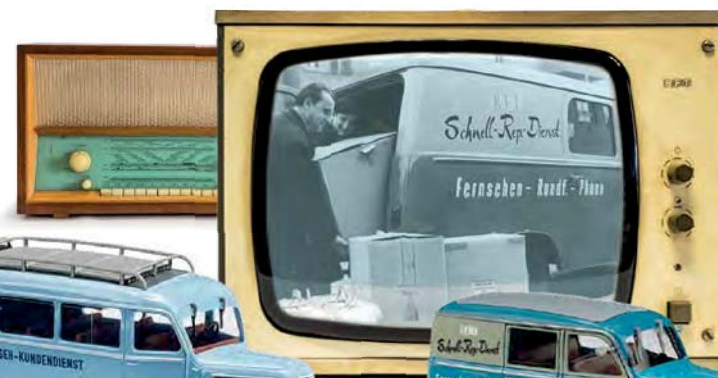
NEU 51862 Robur Garant K 30 Kombiwagen »Rafena Fernseh Service«, Baujahr 1957