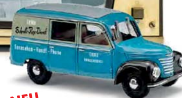
NEU 51277 Barkas V901/2 Halbbus »RFT Kundendienst«