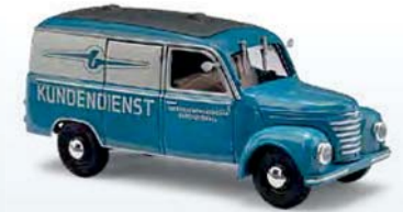
51246 Barkas V901/2 Kastenwagen Nr. 3 VEB Barkas-Werke Hainichen