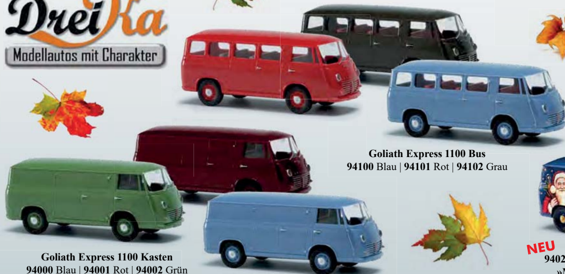
Goliath Express 1100 Bus 94100 Blau | 94101 Rot | 94102 Grau