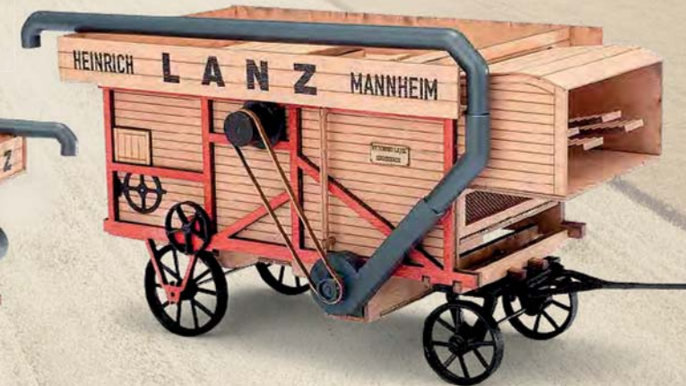
60120 Dreschmaschine 1:32 »Lanz«