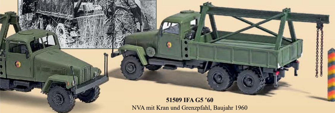
51509 IFA G5 '60 NVA mit Kran und Grenzpfahl, Baujahr 1960