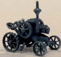
59908 Schweröl Motor Bulldog »Lanz«, Baujahr 1921