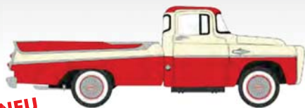
NEU 201 129474 Dodge D100 Sweptside Pick Up 1957, Rot/Weiß