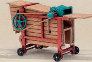
59906 Dreschmaschine kleiner Stiffendrescher, Baujahr 1900