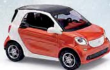
50701 Smart Fortwo Coupé »CMD-Collection«, Baujahr 2014