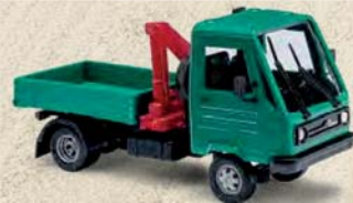
42221 Multicar mit Pritsche und Kran, Baujahr 1991