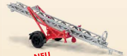
NEU 59960 Anhänger »Feuerwehr« Anhängeleiter AL 12, Baujahr 1980 mit schwarzen Kotflügeln