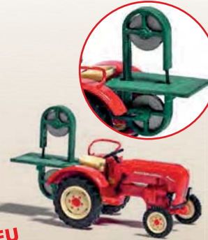
NEU 50011 Traktor Porsche Junior K mit Bandsäge