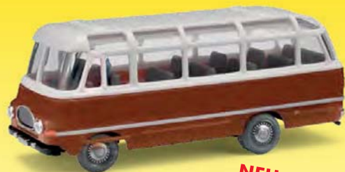
NEU 95708 Robur LO 2500 Braun

Robur LO 2500 und IFA S 4000 sind die aktuellen Formneuheiten im Retrolook der Firma EsPeWe. Die bewusst einfach gehaltene Konstruktion der Modelle erinnert an die einstigen Miniaturliebhaber der DDR, die überall im Straßenbild zu sehen waren. Die aus Kunststoff in Fernost produzierten Modelle sind exklusiv im Vertrieb der Firma Busch.