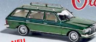
NEU 46812 Mercedes-Benz W123 »Old School«, Zypressengrün metallic, Baujahr 1977