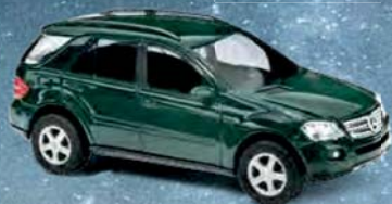
49810 Mercedes-Benz M-Klasse W164 Baujahr 2005