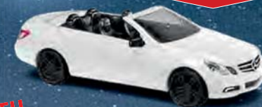
NEU 41680 Mercedes-Benz E-Klasse Cabriolet Sport, Weiß, Baujahr 2010