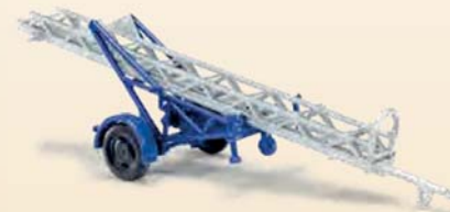
59941 Anhänger »THW« Anhängeleiter AL 12, Baujahr 1980