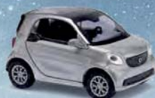
50703 Smart Fortwo Coupé »CMD-Collection«, Baujahr 2014