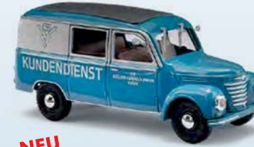
NEU 51292 Barkas V901/2 Halbbus Nr. 7 BVF Berliner Vergaser Fabrik