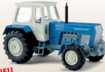
NEU 42847 Traktor Fortschritt ZT 303-D Blau, Baujahr 1967