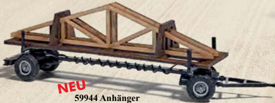
NEU 59944 Anhänger mit Dachstuhlelementen