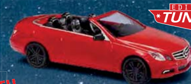
NEU 41679 Mercedes-Benz E-Klasse Cabriolet Sport, Rot, Baujahr 2010