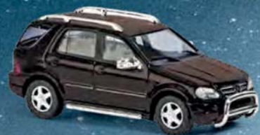
48571 Mercedes-Benz M-Klasse ML55 AMG »Offroad«, (metallic), Baujahr 1998