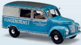
51291 Barkas V901/2 Halbbus Nr. 5 VEB Kraftfahrzeugwerk Horch Zwickau