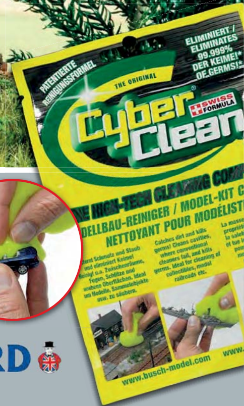
1690 Cyber Clean