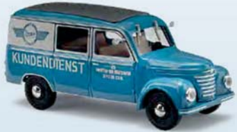
51290 Barkas V901/2 Halbbus Nr. 4 VEB Fahrzeug und Gerätewerk Simson Suhl