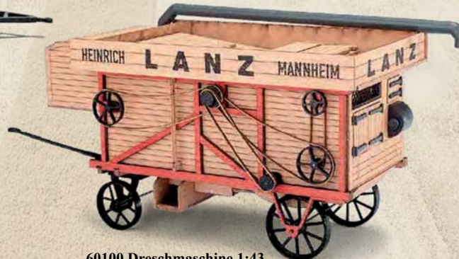
60100 Dreschmaschine 1:43 »Lanz«