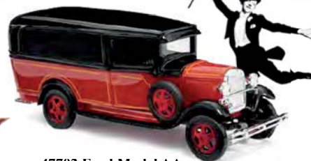
47702 Ford Model AA Nostalgie, Baujahr 1931