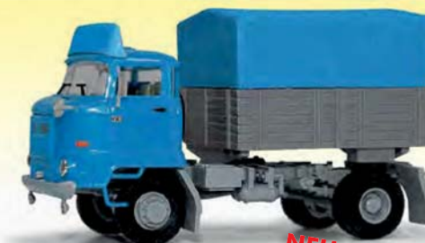
NEU 95537 IFA L60 Zugmaschine BTP-Prishe und Spoiler, Schaustellerzugmaschine