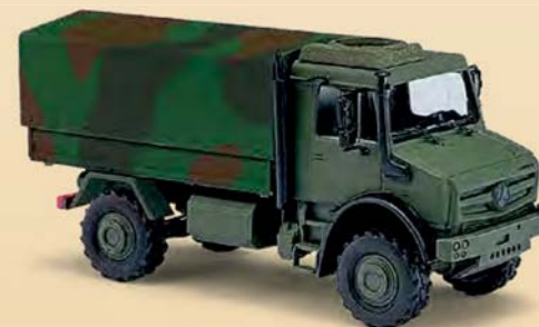
51021 Mercedes-Benz Unimog U 5023 Tarnfarben, Baujahr 2014