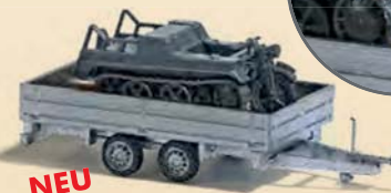
NEU 59959 Transport-Anhänger Transport-Anhänger mit Kettenrad