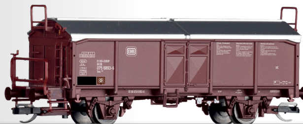
Schiebedachwagen Tms 851 der DB Sliding roof car Tms 851 of the DB