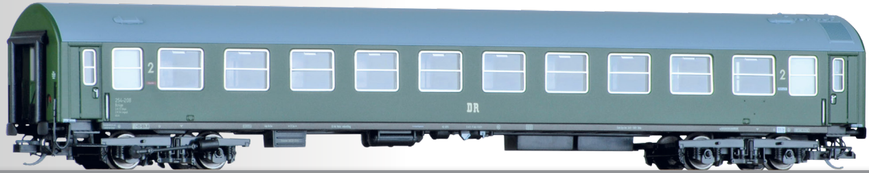
Liegewagen 2. Klasse, Typ B, der DR 2nd class couchette coach, type B, of the DR