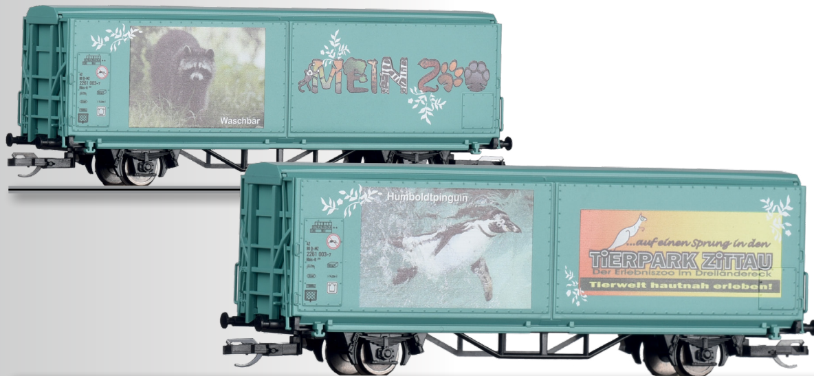
START-Schiebewandwagons Hbis-tt „Mein Zoo“ START-Sliding wall box car Hbis-tt “Mein Zoo”