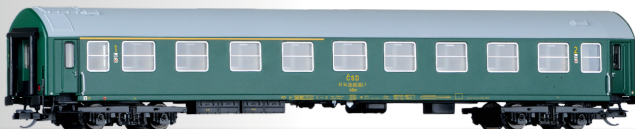
Reisezugwagen 1./2. Klasse, Typ Y, der ČSD 1st/2nd class passenger coach, type Y, of the ČSD