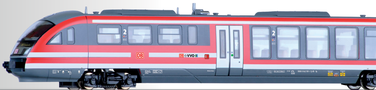
Dieseltriebwagen BR 642 „VVO“ der DB AG Rail car class 642 "VVO" of the DB AG