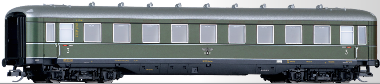
Reisezugwagen 3. Klasse der DRG 3rd class passenger coach of the DRG