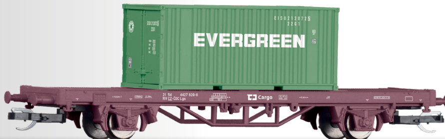
START-Containertragwagen Lgs der ČD, beladen mit 20' Container START-Container car Lgs of the ČD with load