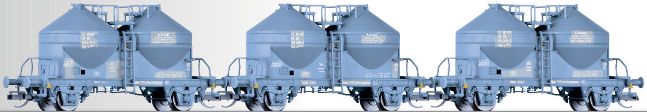
Güterwagenset der DR, bestehend aus drei Staubsilowagen Ucs-v 9122 Freight car set of the DR with three silo cars Ucs-v 9122