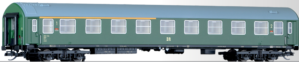
Reisezugwagen 1./2. Klasse, Typ B, der DR 1st/2nd class passenger coach, type B, of the DR