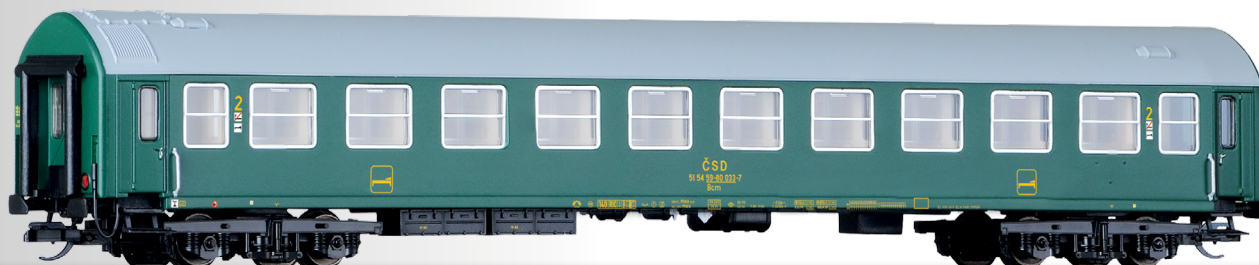
Liegewagen 2. Klasse, Typ Y, der ČSD 2nd class couchette coach, type Y, of the ČSD